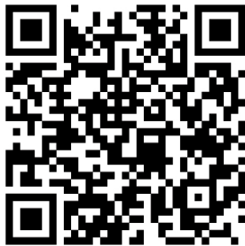
QR code APPLE

Scannez le code QR ici pour télécharger l'application Brel-home :