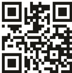
QR code du Site

Scannez le code QR ici pour aller sur le site web: